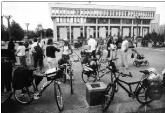
am Start vor dem litauischen Parlamentgebäude in Vilnius