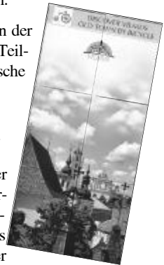
neu in Vilnius: Übersichtskarte mit Tipps für Radler

Für die Presse müssen wir noch einmal im Kreis um das Rathaus herum fahren, dann haben wir zwei Stunden frei zum Kennenlernen der Stadt. Wir schlendern mit unseren Rädern an der Hand durch die Laisves-Allee und kaufen Eis, Tomaten und Mineralwasser. Danach warten wieder die Polizeiwagen auf uns – natürlich nur für die übliche Eskorte bis an den Stadtrand. Am südlichen Ufer des gemächlich dahinfließenden Nemunas geht es bis zur kleinen Kirche von Zapyškis, auf einer grünen Wiese am Flußufer. Nur das Kirchenschiff hat Fluten und Kriege überstanden, aber die Umgebung gibt ein wunderbares Terrain ab für eine ausschweifende Feier. Abends wird in großen Kesseln Essen gekocht für die müden Radler, und eine Sangesgruppe des