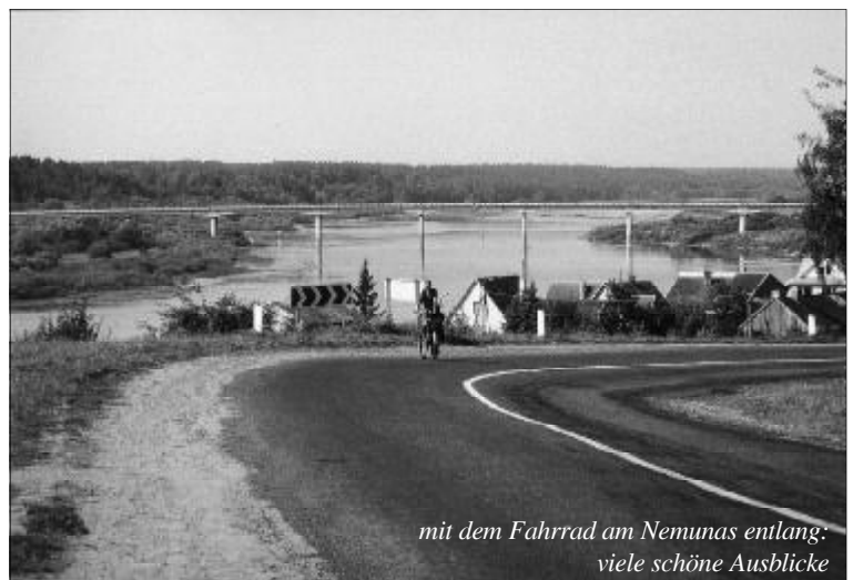
mit dem Fahrrad am Nemunas entlang: viele schöne Ausblicke