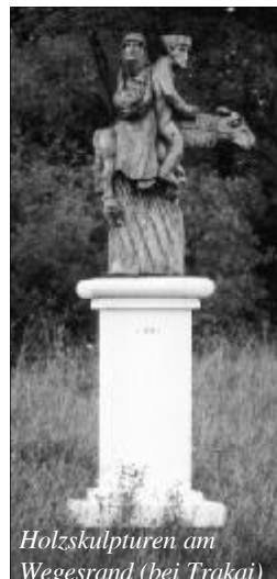
Holzskulpturen am Wegesrand (bei Trakai)