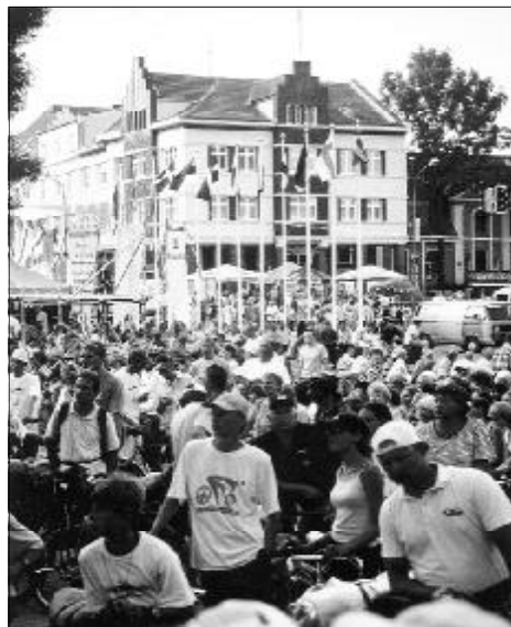
Abschluß in Klaipėda: pünktlich zu den Feierlichkeiten des 750-jährigen Jubiläums der Stadtgründung