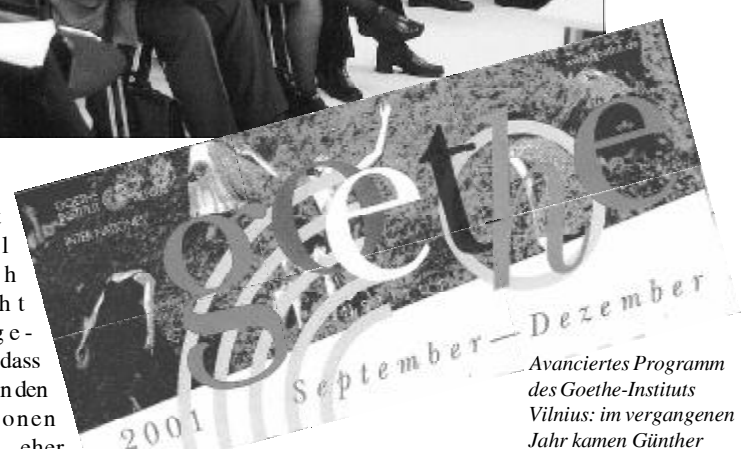
Avanciertes Programm des Goethe-Instituts Vilnius: im vergangenen Jahr kamen Günther Grass und Česlaw Milosz, im Herbst 2001 gastierte unter anderem das Tanztheater Pina Bausch

Einige Gemeinsamkeiten konnten die litauischen, deutschen und französischen Diskutanten feststellen: Die Auf-