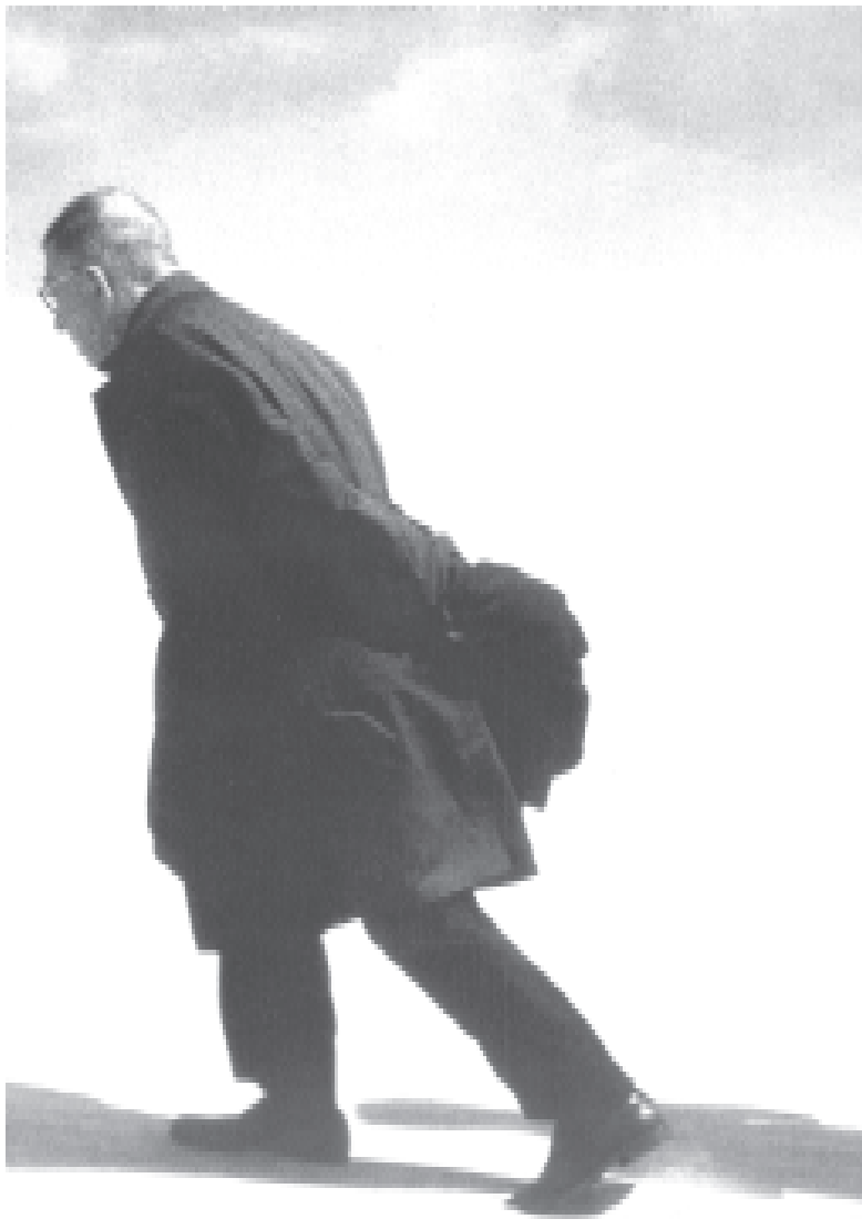
Ausschnitt von einem der berühmtesten Fotos von Antanas Sutkus: Jean Paul Sartre auf der Kurischen Nehrung

Antanas Sutkus: Fotografijos/Photographs 1959-1999. Baltos Lankos, Vilnius, 2000. ISBN 9955-00-024-4.