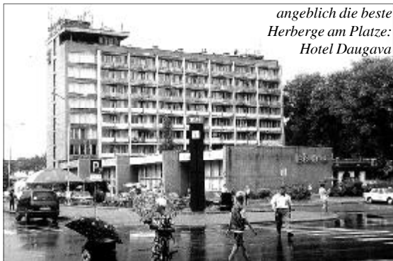
angeblich die beste Herberge am Platze: Hotel Daugava

Gute, die darin leben oder die draußen die Straßen benutzen. Wer aber Daugavpils heute sieht, der sehnt sich eventuell zurück zu den Landschaften Latgales. Wie eine Insel im Zeitenstrom trotz Daugavpils allenscheinbar unvermeidlichen Mitbringens der Marktwirtschaft und des Warenstroms aus