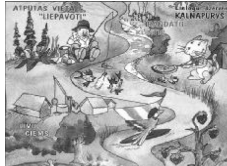
Ausschnitte aus einem Werbe-prospekts des Bezirks Alūksne

Solche Schaustellereien haben ja auch für die Beobachter ihren Reiz - aber was dann in der Nacht folgt, sicher nicht mehr. Jetzt sind es die Jugendlichen, die stark angetrunken mit mehreren PKWs quer übers Gelände fegen, wobei im Zelt sich schnell das Gefühl breit macht, man könne auch mal „übersehen“ werden. In völliger Dunkelheit und reichlich alkoholisiert ins Wasser zu gehen, ist hier offenbar so eine Art Volkssport. Nun gut, irgendwann ist Ruhe - aber als wir am nächsten Tag bei unserer ersten Rast von einem alten Mütterchen erfahren, dass im Nachbarort ähnlicher Übermut einen jungen Mann das Leben gekostet hat (nachts ertrunken im Fluss), da beherrschen uns endgültig die Zweifel, wo hier der Spass an der ganzen